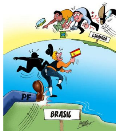
(BORGES, M. Disponível em: http://www.chargeonline.com.br . Acesso em: 11 mar. 2008.)